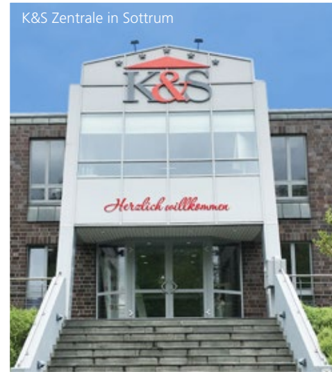
K&S Zentrale in Sottrum

Dafür sprechen auch die sehr guten Bewertungen unserer Leistungen in der Pflege und Betreuung sowie als Arbeitgeber (siehe Einleger).